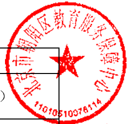
合格申请人商务信息公示表（投标人商务信息公示表）